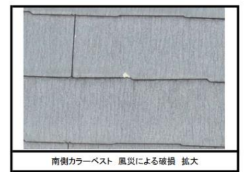
南側カラーベスト 風災による破損 拡大