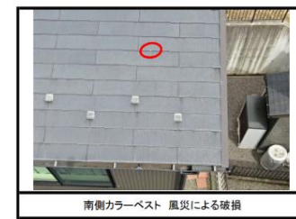
南側カラーベスト 風災による破損