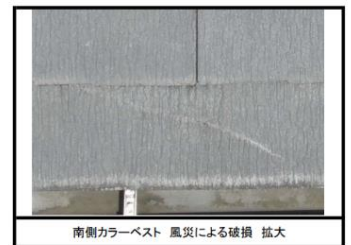
南側カラーベスト 風災による破損 拡大