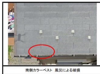
南側カラーベスト 風災による破損